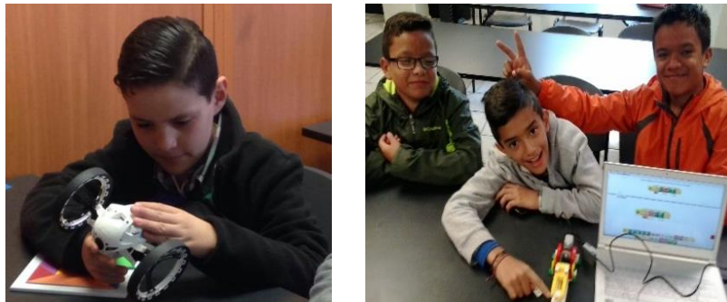
Figura 2. Actividades utilizando tecnología

promueve el interés por las disciplinas científicas y tecnológicas en los niños de la región, tal como se muestra en la Figura 2.