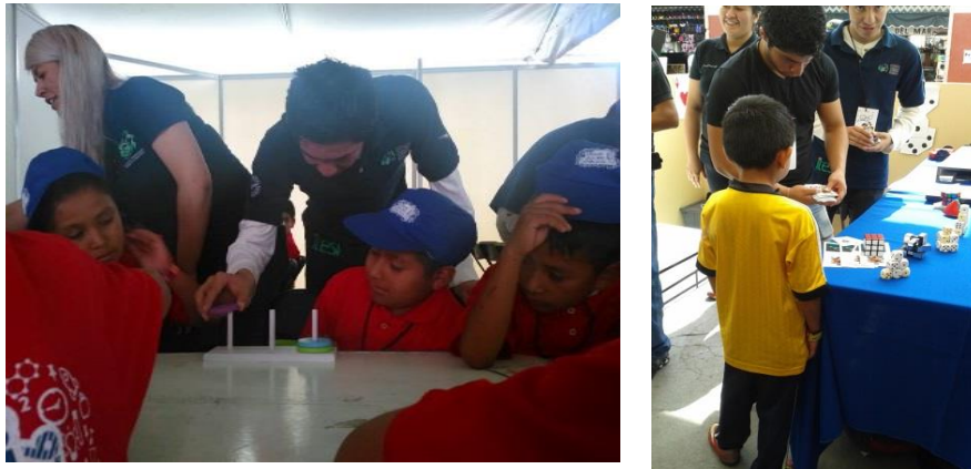
Figura 1. Talleres

semestre, de entre 18 y 21 años. Los estudiantes proponen diversas actividades en donde ellos son los actores principales, en actividades tales como, trucos de magia con dados y cartas, adivinar números con el sistema binario, memoramas temáticos, entre otras, tal como se muestra en la Figura 1, con estas actividades se fomenta el desarrollo de habilidades que van desde la coordinación visomotora, orientación, estructuración espacial, imaginación, memoria visual, atención y concentración, así como paciencia y constancia.