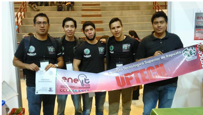
Figura 5. Equipo de trabajo ENEIT 2016

equipo de trabajo conformado por un profesor y 4 estudiantes que participaron en ENEIT regional.