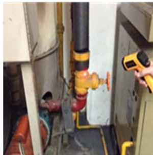
Figura 2. Medición de la temperatura en la línea de suministro.

Si durante los recorridos en campo se hace necesario realizar la medición de alguna variable o parámetro que fuese indispensable para el análisis del sistema, entonces, se procede a su medición como se muestra en la Figura 2.