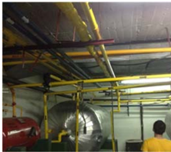
Figura 1. Identificación de componentes del sistema de interés.

Dentro de las actividades realizadas por los estudiantes en sus prácticas de campo se incluyen recorridos físicos del sistema de interés con el propósito de identificar sus componentes, características y datos técnicos (ver Figura 1), así como interactuar con el personal técnico y responsable del sistema que le permita disolver las dudas y complementar la explicación y descripción del sistema de interés.