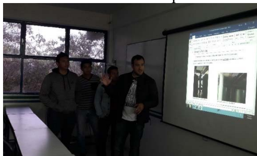
Figura 4. Presentación ejecutiva en el seminario de retroalimentación y socialización de experiencias.

Además, cada brigada debe, a su vez, preparar una presentación ejecutiva para su exposición en el aula mediante un seminario y así, fomentar la socialización de cada una de las experiencias adquiridas durante el desarrollo de sus prácticas de campo, Figura 4.