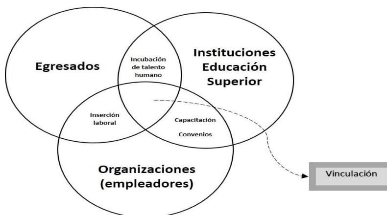
Figura 2. Necesidades entre los grupos de interés en la vinculación. Elaboración Propia.

De la relación de estos tres grupos de interés se denotan situaciones muy específicas las cuales se pueden apreciar en la Figura 2. Necesidades entre los grupos de interés en la vinculación, es decir la razón de ser de las IES es la formación y preparación de futuros profesionistas, en tanto que los alumnos ven en las Instituciones una alternativa para mejorar su calidad de vida y sus expectativas profesionales, por lo que la “incubación de talento humano”, es la relación estrecha que guardan las IES y su alumnado.