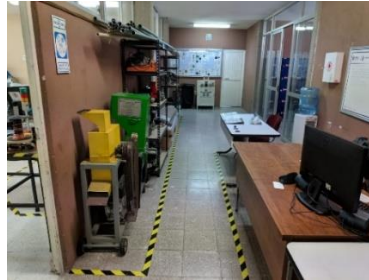
Figura 3. Lobby del CDT. Elaboración propia.

En el espacio número 1 de la Figura 2 designado como lobby, se han colocado mesas para el registro y vigilancia de las áreas de trabajo, se tienen en exposición algunos de los proyectos existentes y se cuenta con anaqueles con inventario de motores y algunos accesorios mecánicos. Ver Figura 3.