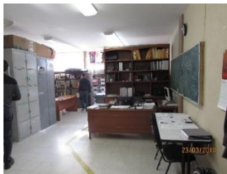
Figura 4. Oficinas. Elaboración propia

En los espacios correspondientes a los números 2, 3 y 4 de la Figura 2 se encuentran las áreas de oficina, estantería con material no inventariable, consumibles, material y herramienta inventariable, como se muestra en las Figuras 4, 5, 6 y 7. Estos materiales y herramientas son usados por los alumnos en la realización de sus proyectos, el material puede abandonar el laboratorio o puede ser trabajando dentro de él, previamente un registro para el control de los inventarios.