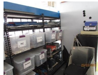
Figura 5. Material no inventariable. Elaboración propia