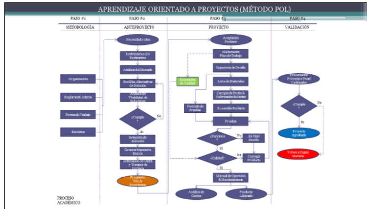
Figura 1. Aprendizaje orientado a proyectos. Elaboración propia

También se formularon la Visión y los Valores del CDT como parte de la creación de este Centro, en donde se puede ver que adicionalmente a su aportación a la asignatura de Proyecto Integrador también se busca que se un apoyo a otras áreas.