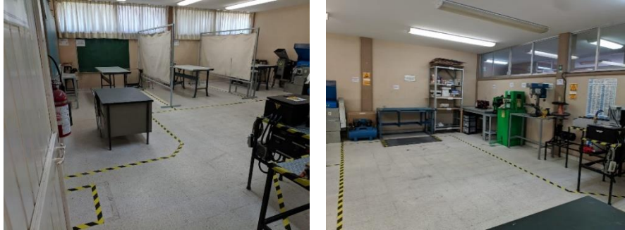
Figura 8 y 9. Área de fabricación y ensamble . Elaboración propia.

En la sección número 5 de la Figura 2, podemos encontrar las áreas de trabajo en donde los alumnos pueden realizar procesos de corte, perforado, punteado de soldadura, pulido y torneado de piezas pequeñas, además de ensamblar sus prototipos y realizar pruebas, ver Figuras 8 y 9. Es conveniente resaltar que el espacio cuenta con conexiones a 110 y 220 volts además de un compresor de aire.