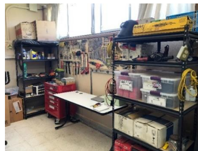
Figura 7. Herramienta y consumibles Elaboración propia