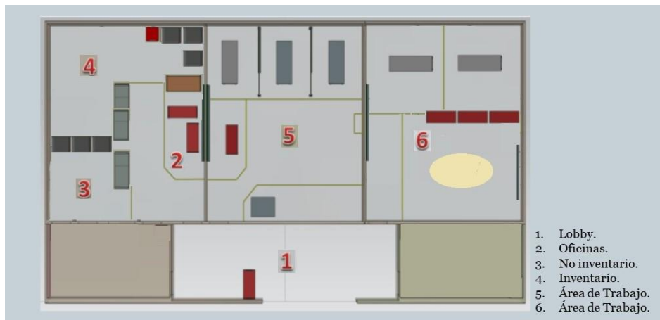
Figura 2. Lay out del Centro de Desarrollo tecnológico (CDT). Elaboración propia.

El Centro de Desarrollo Tecnológico, actualmente cuenta con 192 mts 2 , los cuales se distribuyen como lo muestra la Figura 2.