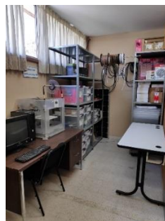
Figura 6. Material inventariable Elaboración propia