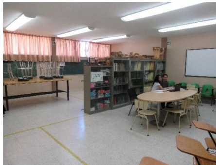
Figura 10. Área de trabajo. Elaboración propia

El espacio número 6 de la Figura 2 cuenta con áreas de trabajo para que los alumnos puedan planear, elaborar sus reportes, ensayar sus presentaciones y documentar todo el proyecto, como se muestra en la Figura 10. Adicionalmente, se cuenta con literatura como folletería, catálogos, revistas y libros de consulta.