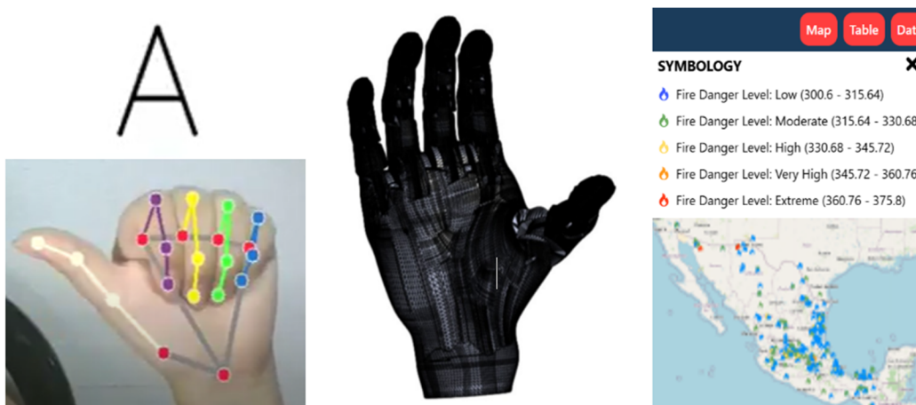
Figura 2. Proyectos de Investigación Aplicada de CEII UNAM.