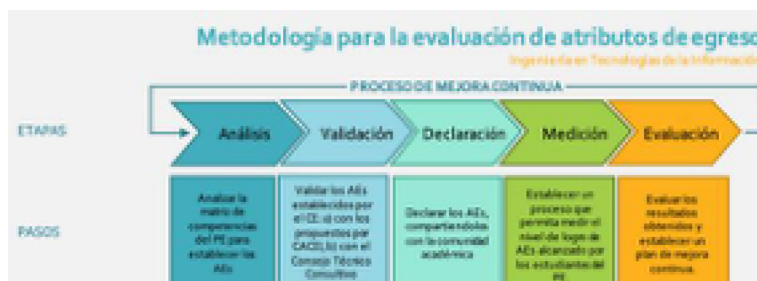
Figura 1. Metodología para la evaluación de AEs.

Para realizar la definición y evaluación de los AEs del PE de ITI se siguió la metodología mostrada en la Figura 1.