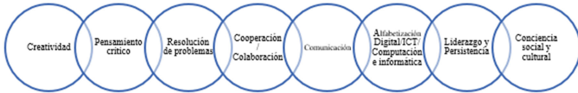
Figura 1. Habilidades para la industria 4.0 determinado para el presente estudio